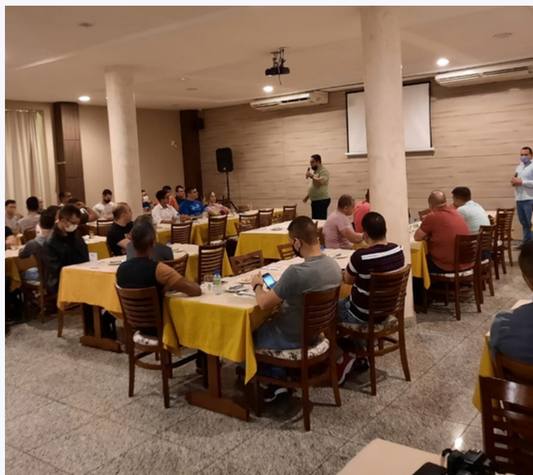
Feira de Santana