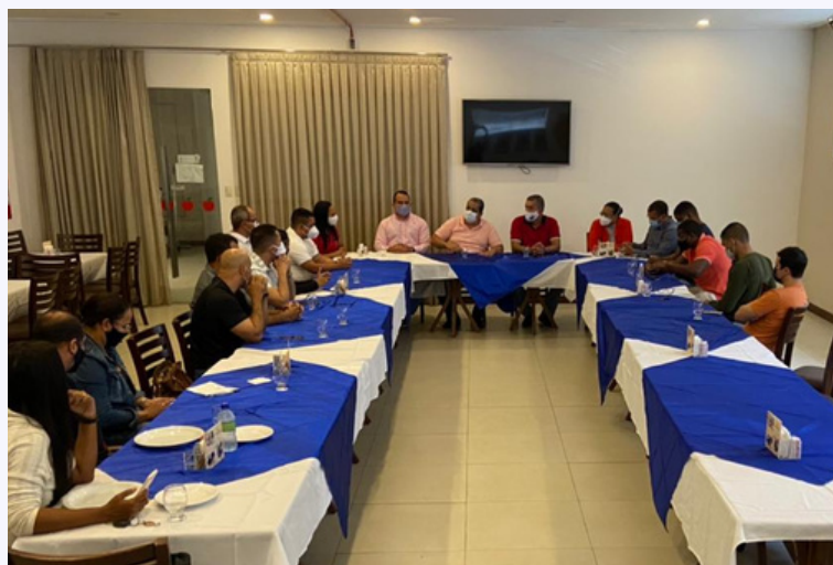
Santo Antônio de Jesus

“Por onde temos passado os associados têm comparecido e contribuído para essa discussão tão importante, o que nos motiva a seguir nesse ritmo. Entendemos a importância de escutá-los nesse processo de construção das soluções relacionadas a remuneração e promoções dentro da instituição”.