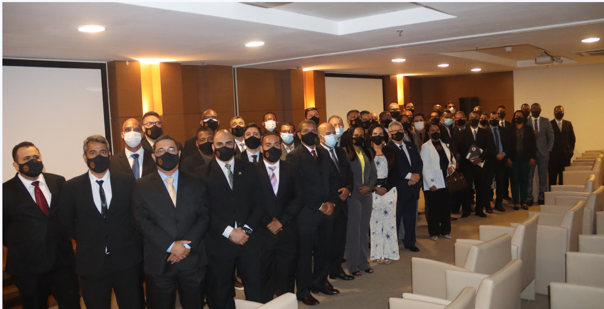
Formandos da terceira turma do Curso de Assessoria Parlamentar

A parceria da Força Invicta e FENEME consagrou a realização da III edição do Curso de Assessoria Parlamentar. A Solenidade de Encerramento aconteceu no dia 14/10, com a participação dos alunos e autoridades da Polícia Militar e do Corpo de Bombeiros Militar da Bahia. Em virtude do contexto pandêmico, a capacitação foi realizada de forma virtual durante os meses de setembro e outubro, com carga horária total de 16h. Na oportunidade, 48 formandos receberam os Certificados de Conclusão do Curso e participaram da Aula Magna final proferida pelo Ten Cel PMMG Lázaro Tavares de Melo da Silva.