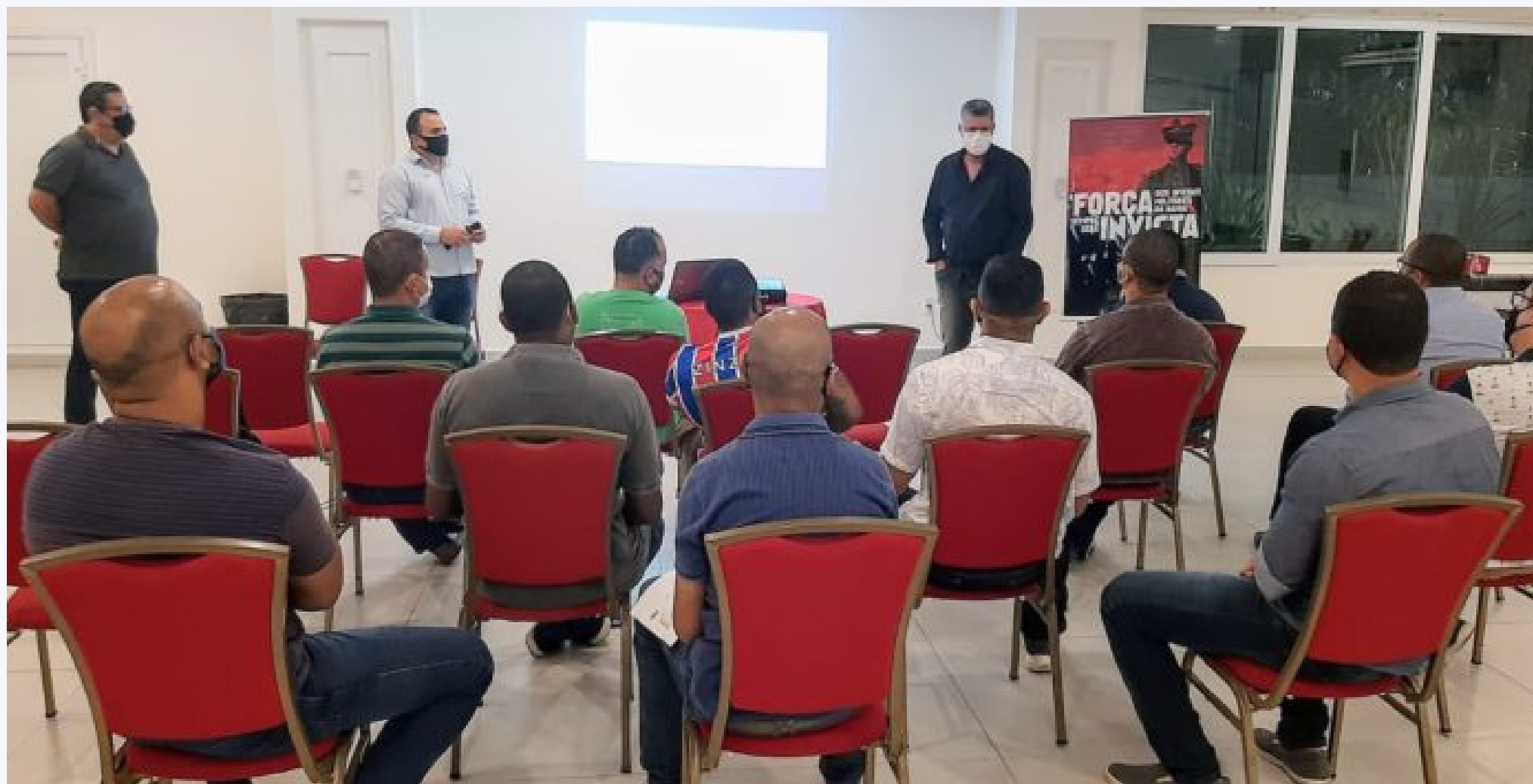
Encontro em Porto Seguro

"Esse ciclo de reuniões que temos construído favorece aos militares estaduais da Polícia Militar e do Corpo de Bombeiros Militar da Bahia a partir do momento em que ouvimos as reais necessidades deles e dialogamos sobre os caminhos a serem percorridos para suprir essas carências. Partilhamos dos mesmos ideais e o que queremos é juntos podermos construir ambientes favoráveis que nos coloquem numa melhor posição no País".