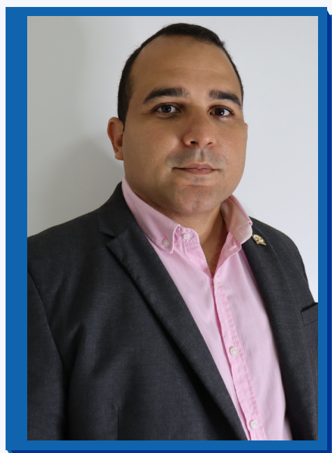
Cap PM Igor Rocha

Elogiados pela forma de condução das tratativas, no que diz respeito às ações de reivindicação das demandas dos militares estaduais, a qual imprime à Associação maturidade nos processos de diálogos junto ao Governo para construção das soluções, o Superintendente esclareceu o cenário orçamentário estadual e suas limitações, e comprometeu-se em analisar de forma criteriosa o documento apresentado.